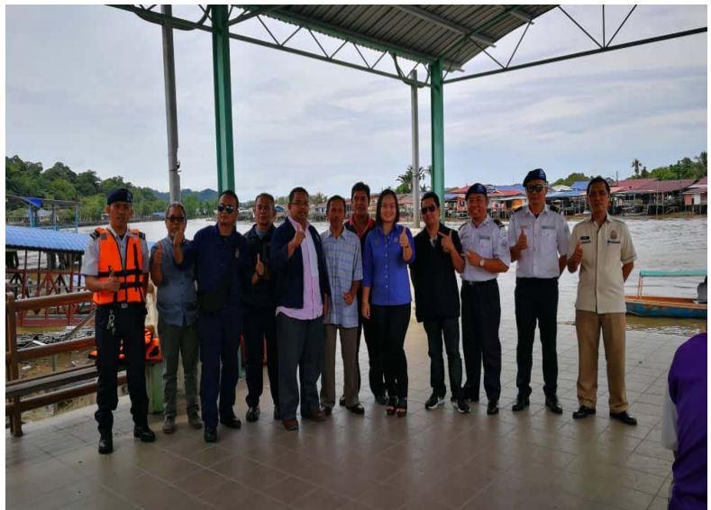
Bersama Pegawai Lembaga Sungai-Sungai Sarawak Bahagian Limbang, Ketua Kampung dan penduduk setempat / Together with Sarawak River Board Officer's Limbang Region, Ketua Kampung and local resident's