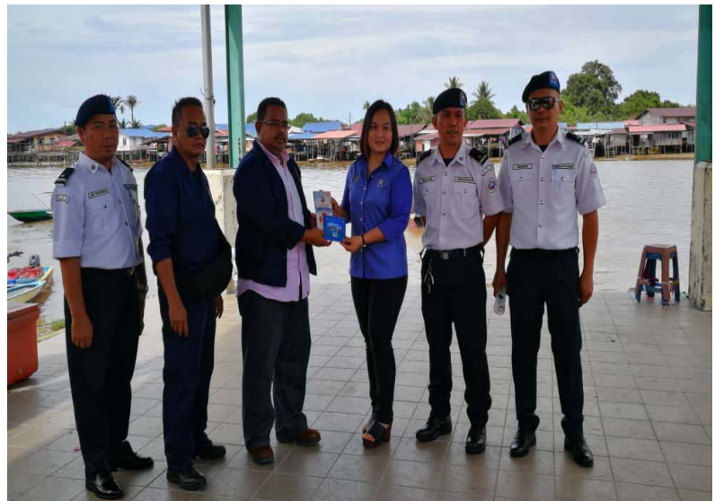
Penyerahan risalah dan CD keselamatan oleh Jabatan Laut Wilayah Sarawak kepada Lembaga Sungai-Sungai Sarawak Cawangan Limbang / Giving session of the safety brochures and CD's by Marine Department Sarawak Region to Sarawak Rivers Board Limbang Region