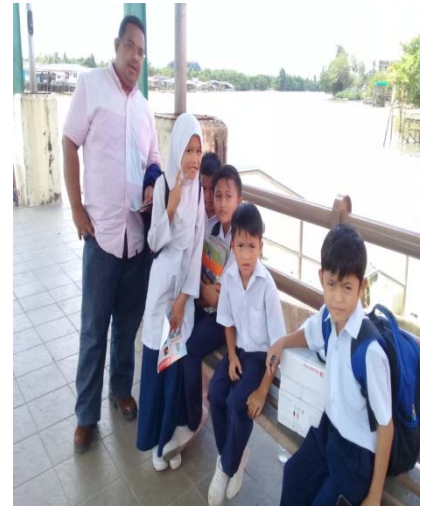
Pelajar-pelajar menunggu bot penambang untuk ke kampung seberang / The students are waiting for the passenger's boat to opposite village