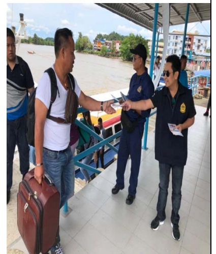
Pengagihan risalah keselamatan kepada penumpang bot ekspres / Distribution of safety brochures to express boat passenger's