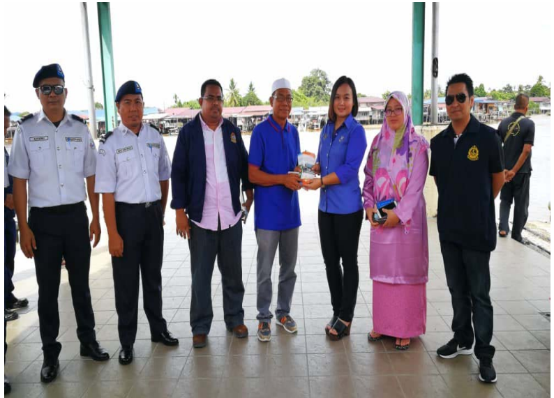
Penyerahan risalah keselamatan oleh Pegawai Lembaga Sungai-Sungai Sarawak Cawangan Limbang / Giving session of the safety brochures by Sarawak Rivers Board Officer Limbang Region