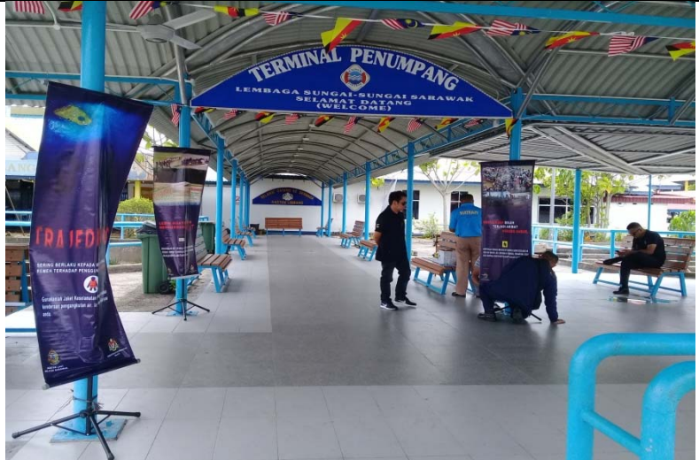
Terminal Penumpang Bot Ekspress Limbang / Express boat passenger Terminal Limbang