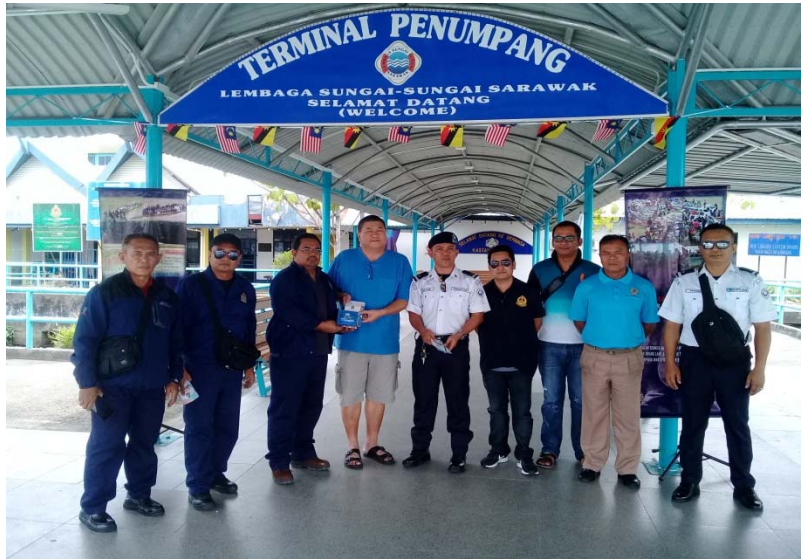
Penyerahan risalah dan CD keselamatan kepada pemilik bot ekspres / Giving session of the safety brochures and CD's to express boat's owner