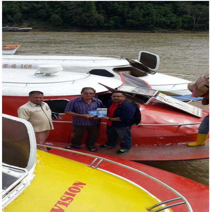
Serahan risalah dan CD keselamatan kepada jurumudi bot ekpress / Given to safety brochures and CD to express boat master's.