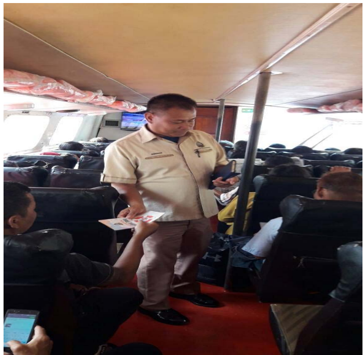
Penerangan keselamatan kepada penumpang bot ekpress / Safety explanation to express boat passanger's.