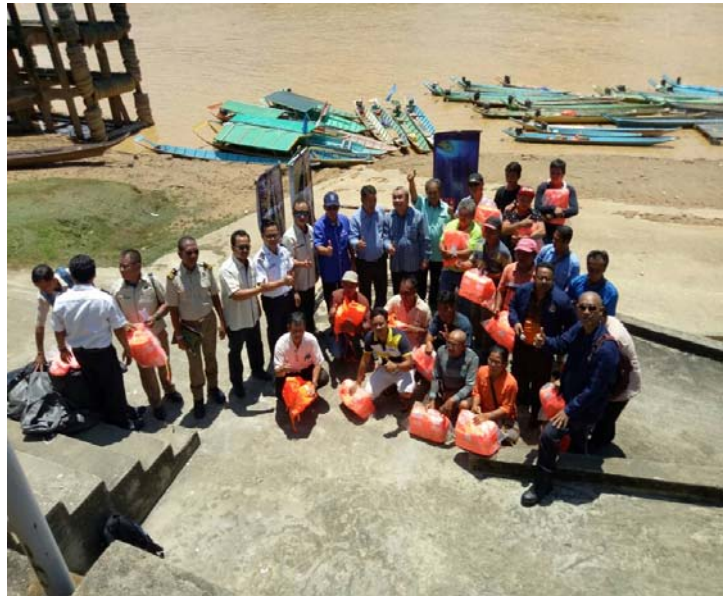
Bergambar bersama penerima jaket keselamatan dari JLWS / Picture together life jacket recipient's by JLWS.