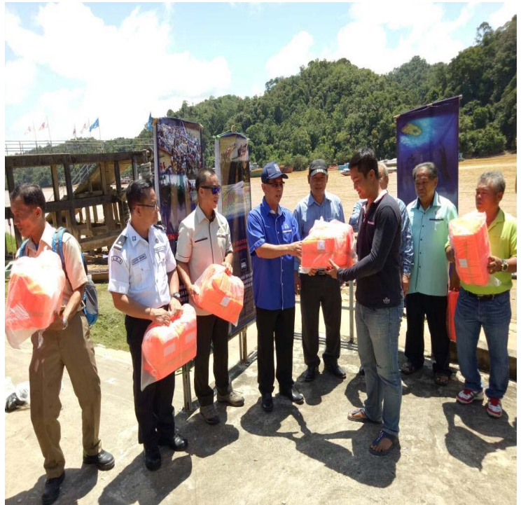
Pengagihan jaket keselamatan kepada pengusaha bot panjang oleh YB Jefferson Jamit / Distribution of life jacket to long boat owner's by YB Jefferson Jamit.